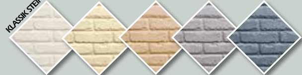
WEISS-BEIGE HELLGELB SAND GRAU-BRAUN ANTHRAZIT