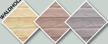
HELLGELB BRAUN GRAU-BRAUN