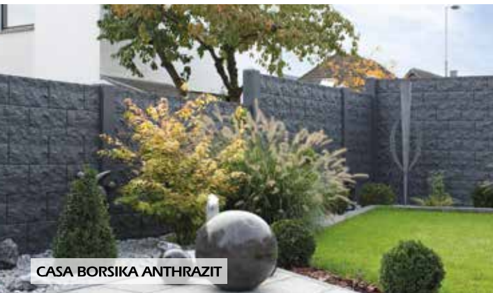
CASA BORSIKA ANTHRAZIT